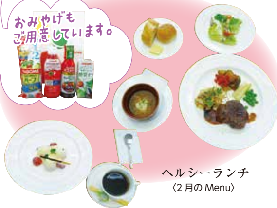
ヘルシーランチ (2月のMenu)